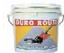
Conditionnement en seaux de 25 kg

DURO ROUTE se conserve 12 mois en seaux hermétiquement fermés. Il est recommandé de stocker les seaux dans un local tempéré, et de ne pas les empiler sur plus de 4 rangées.